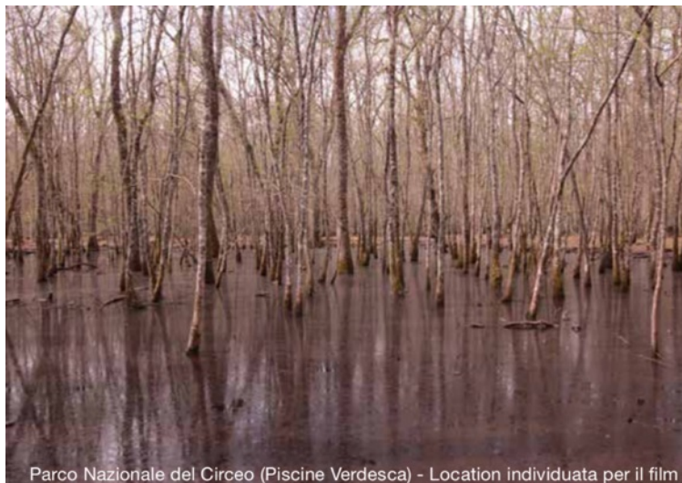
Parco Nazionale del Circeo (Piscine Verdesca) - Location individuata per il film

È stata spontanea la scelta di guardare al Lazio come area di ricerca principale, dove storicamente si è svolta la vicenda. E proprio in questa regione sono state individuate tutte le tipologie di paesaggi in cui si muovono i personaggi del film: zone paludose, greti di fiumi, montagne rocciose, foreste e boschi mediterranei, spiagge, saline, zone termali e sulfuree. Aree naturali protette che ci riportano a quella tipologia di ambienti incontaminati in cui l'intervento dell'uomo e le costruzioni moderne sono assenti o occultabili.